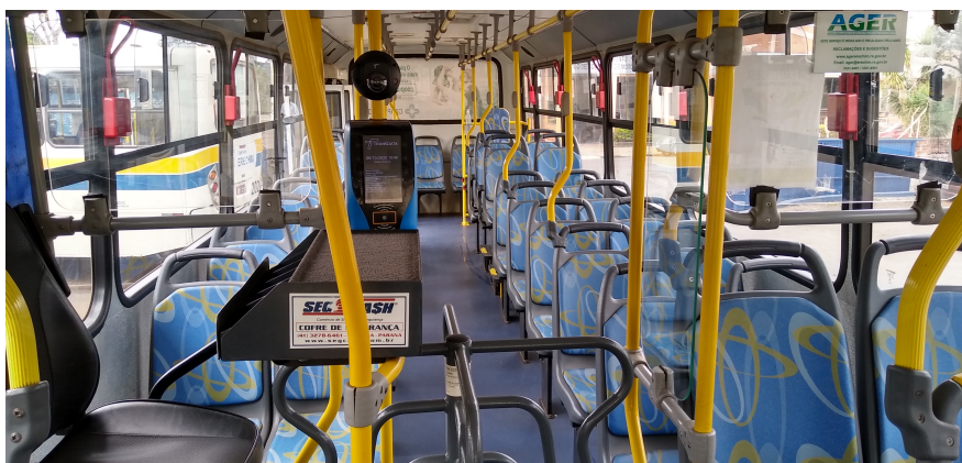
Foto 2 Interior do veículo