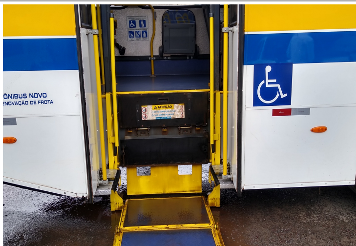
Foto 1 Plataforma Elevatória