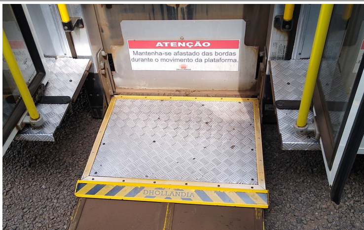
Foto 1 Plataforma Elevatória