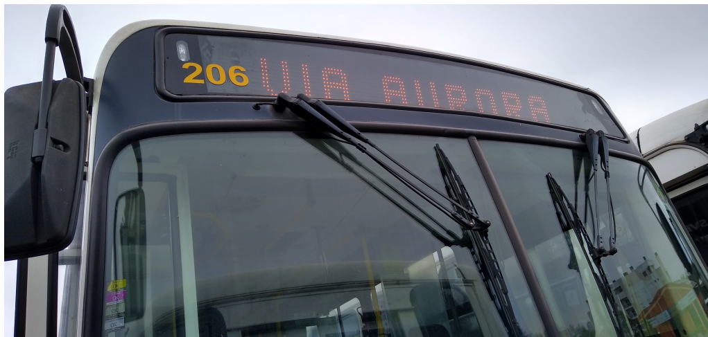
Foto 3 Informações do Itinerário