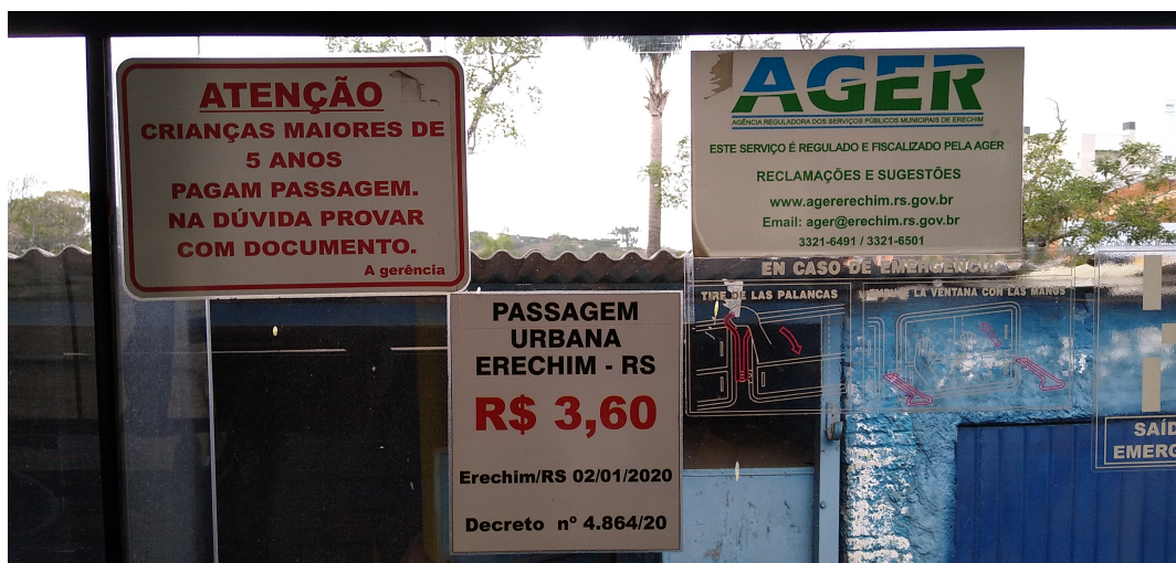
Foto 4 Informações sobre valor da tarifa e telefone da AGER