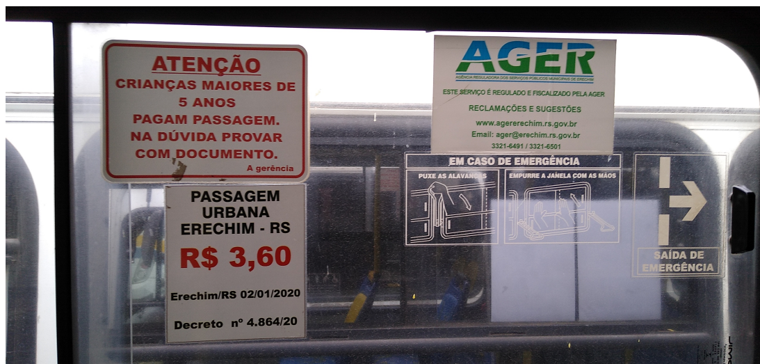
Foto 4 Informações sobre valor da tarifa e telefone da AGER