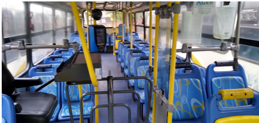
Foto 2 Interior do veículo