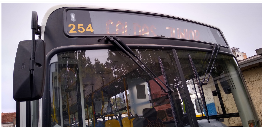
Foto 3 Informações do Itinerário