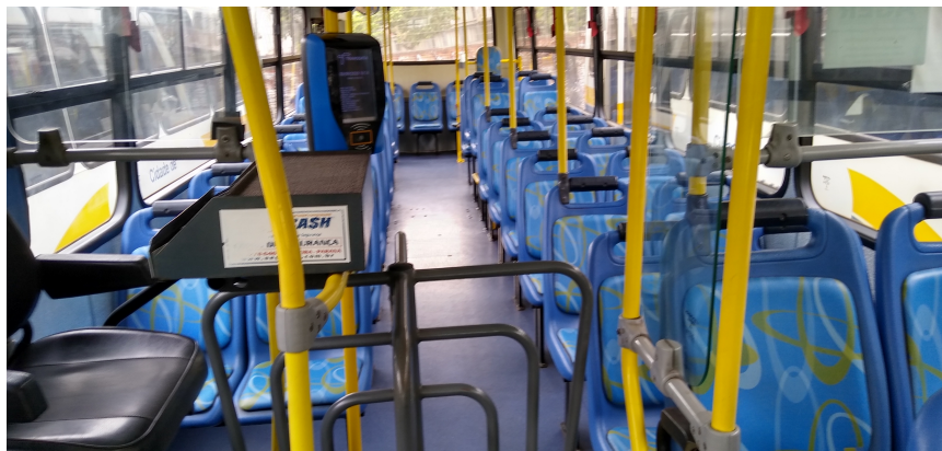
Foto 2 Interior do veículo