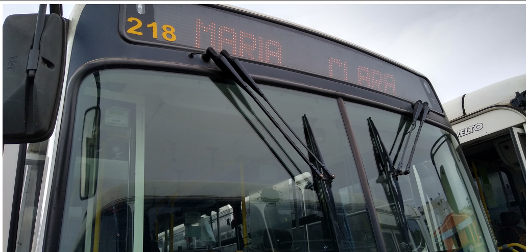
Foto 3 Informações do Itinerário