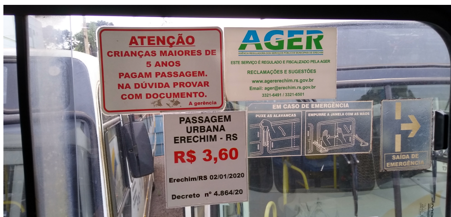
Foto 4 Informações sobre valor da tarifa e telefone da AGER