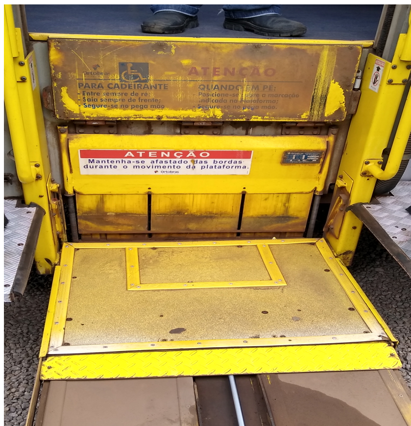
Foto 1 Plataforma Elevatória