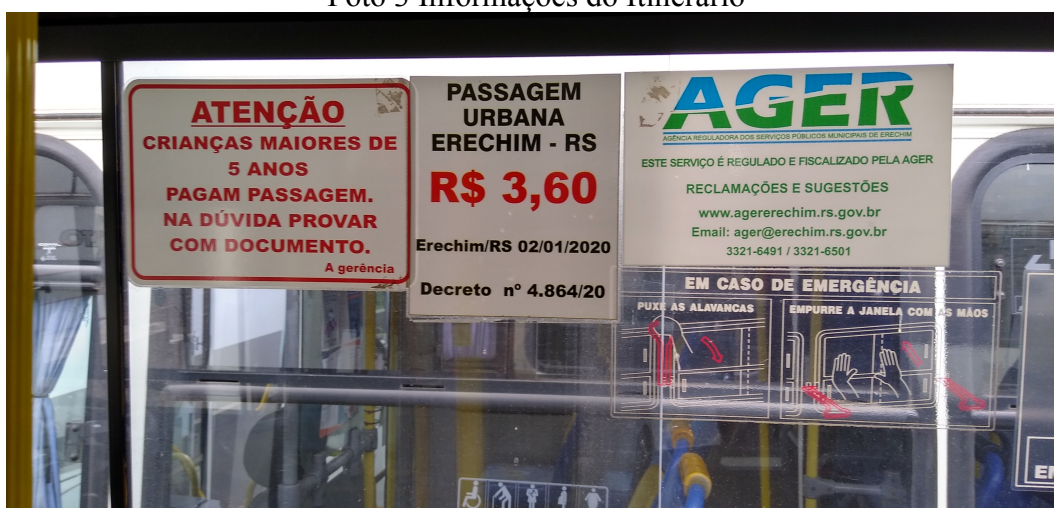
Foto 4 Informações sobre valor da tarifa e telefone da AGER