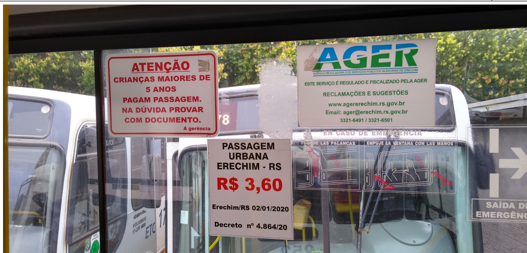
Foto 3 Informações sobre valor da tarifa e telefone da AGER