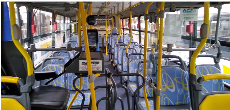
Foto 2 Interior do veículo