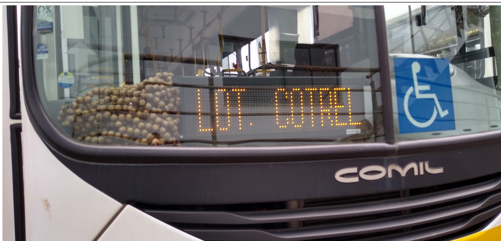
Foto 3 Informações do Itinerário