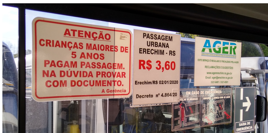
Foto 4 Informações sobre valor da tarifa e telefone da AGER