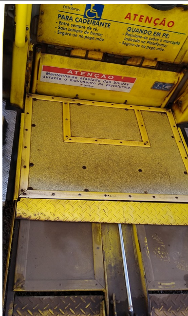
Foto 1 Plataforma Elevatória