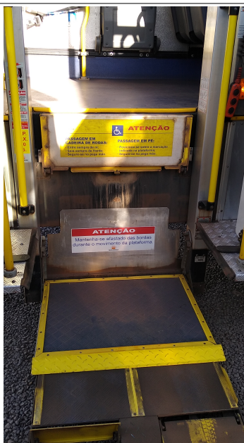
Foto 1 Plataforma Elevatória