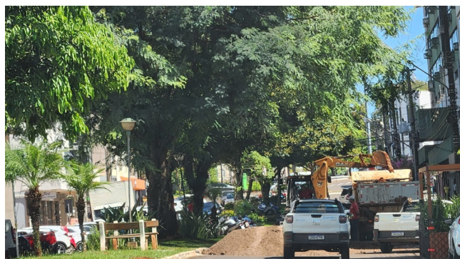
Av. Quinze de Novembro

Rua Miguel Reinert, 231 – José Bonifácio