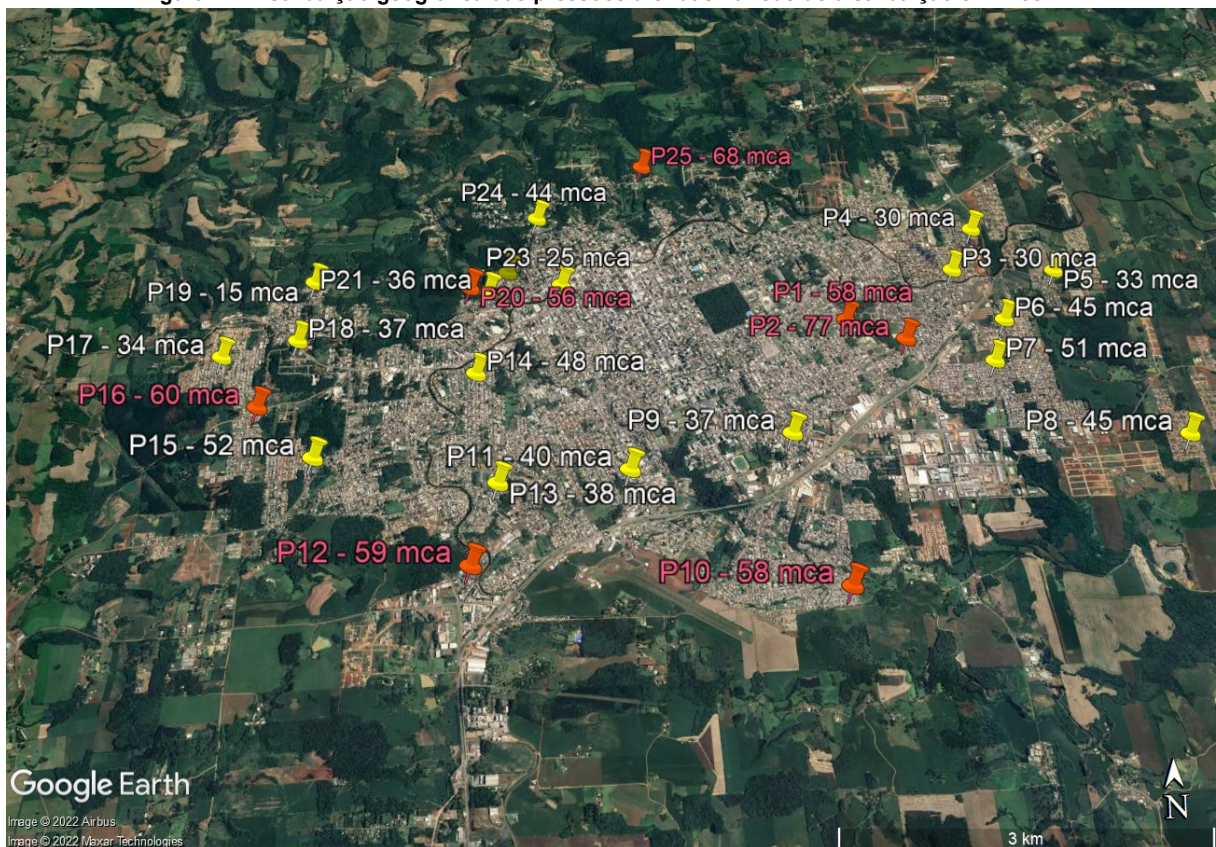
Figura 1 – Distribuição geográfica das pressões aferidas na rede de distribuição em Erechim