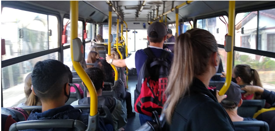
Foto 1 Interior do Veículo