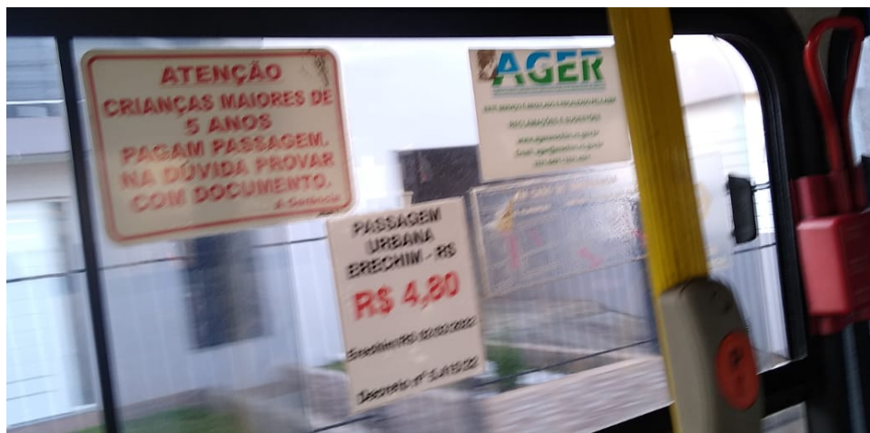
Foto 3 Informações fixadas no veículo