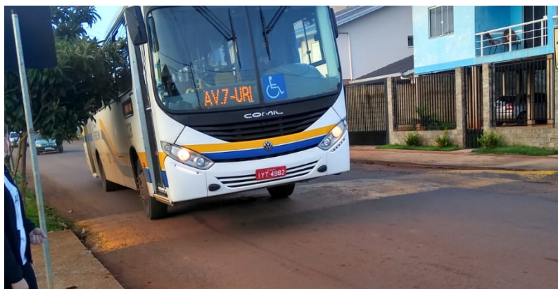
Foto 4 Informações do Itinerário