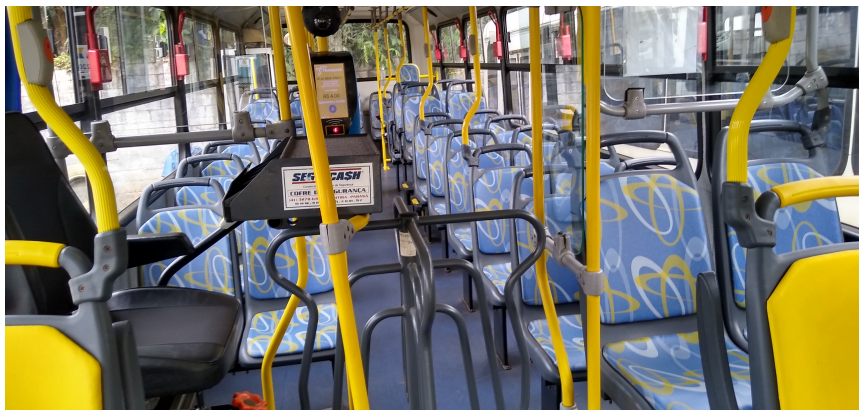
Foto 2 Interior do veículo