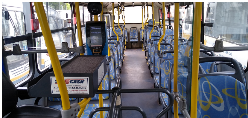
Foto 2 Interior do veículo