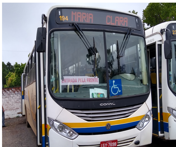
Foto 4 Informações do Itinerário