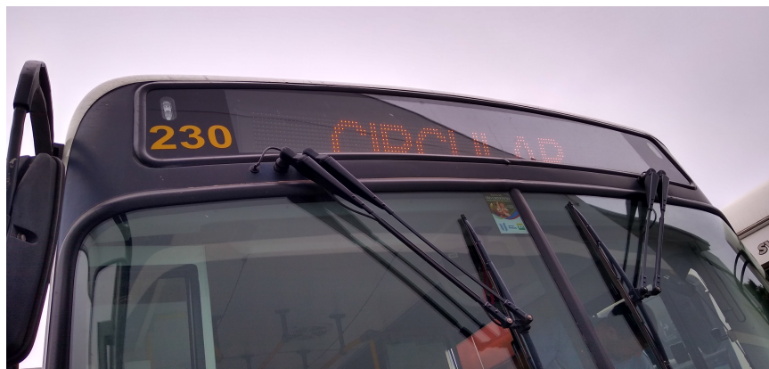
Foto 4 Informações do Itinerário