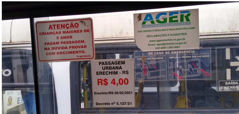
Foto 3 Informações sobre valor da tarifa e telefone da AGER