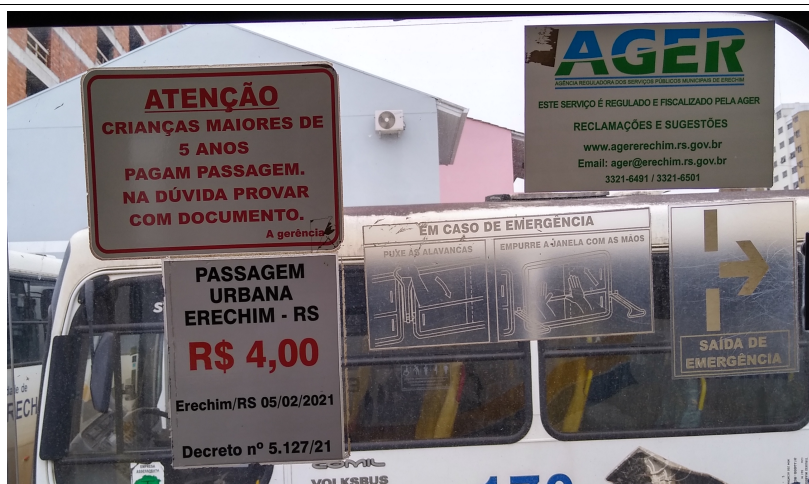
Foto 3 Informações sobre valor da tarifa e telefone da AGER