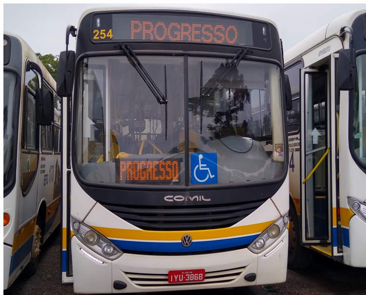
Foto 4 Informações do Itinerário