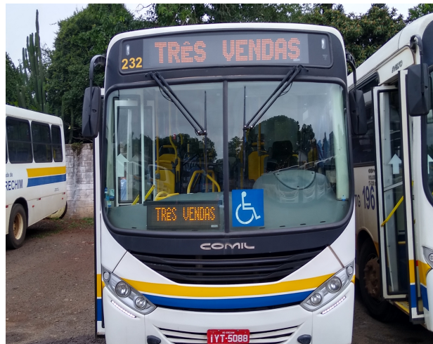
Foto 4 Informações do Itinerário