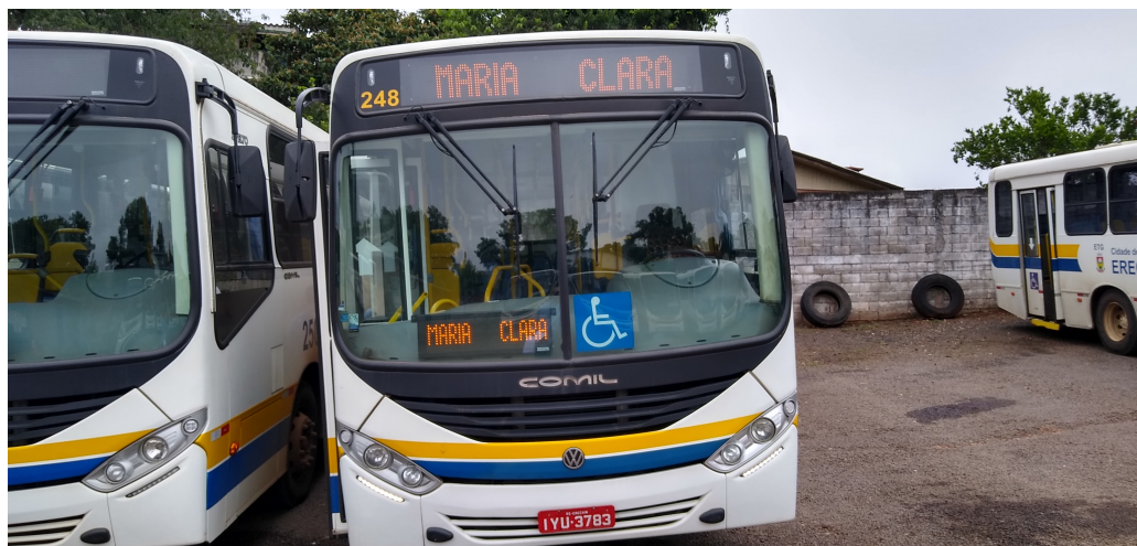
Foto 4 Informações do Itinerário