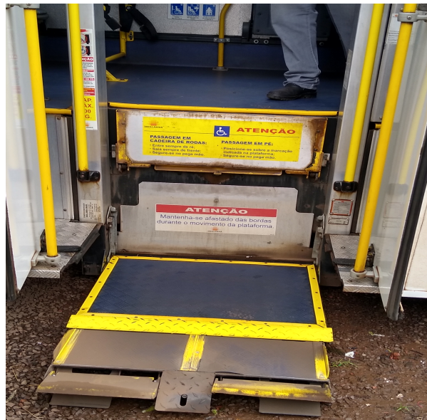
Foto 1 Plataforma Elevatória