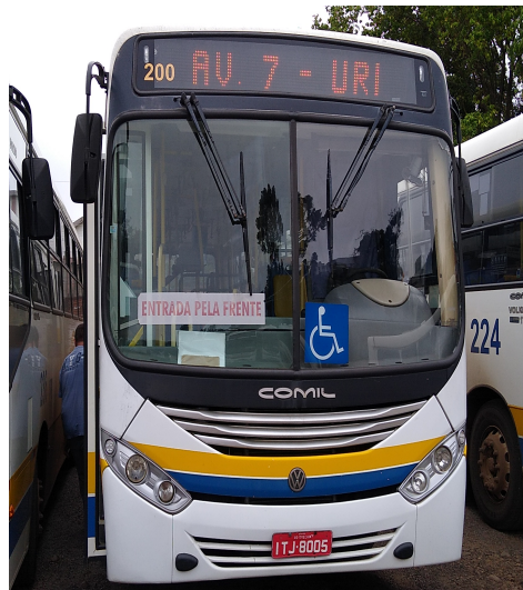
Foto 4 Informações do Itinerário