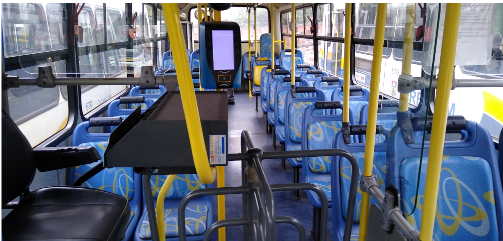
Foto 2 Interior do veículo