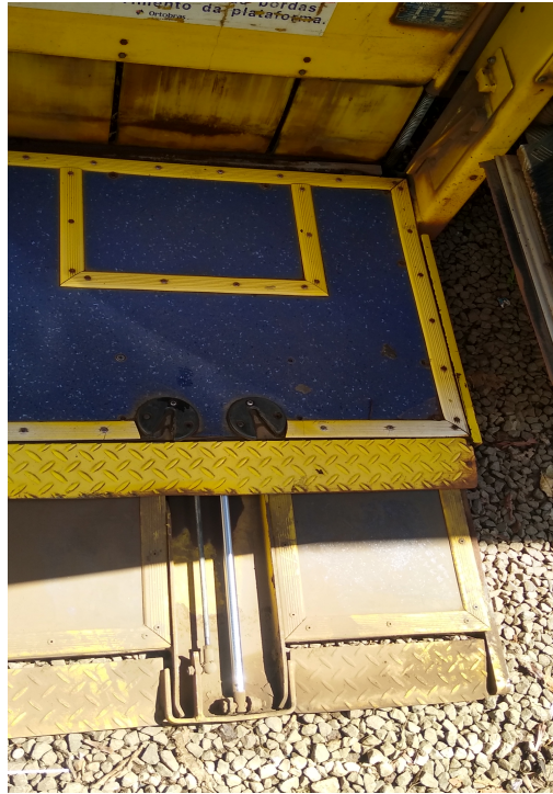
Foto 1 Plataforma Elevatória