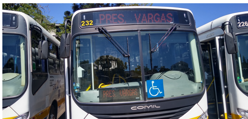
Foto 4 Informações do Itinerário