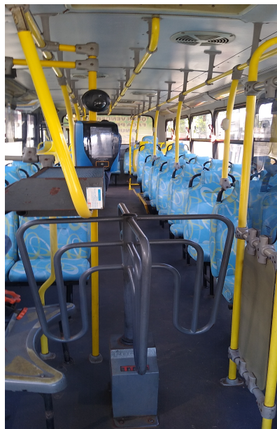
Foto 2 Interior do veículo