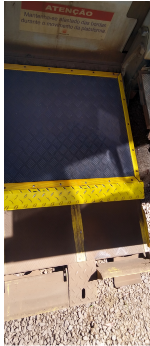
Foto 1 Plataforma Elevatória