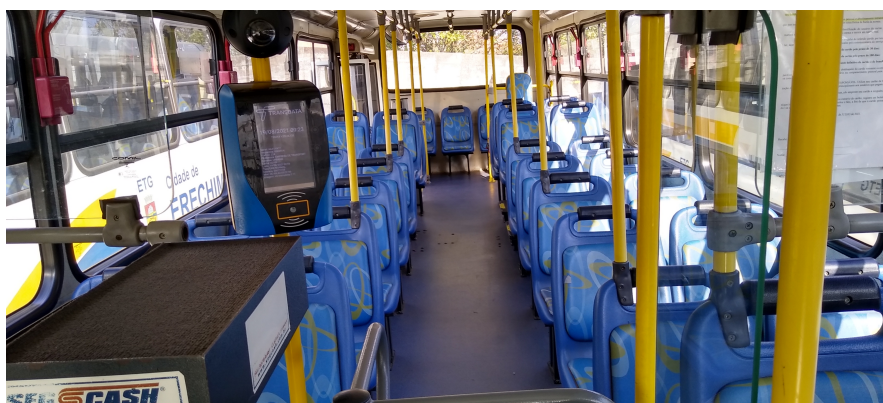
Foto 2 Interior do veículo