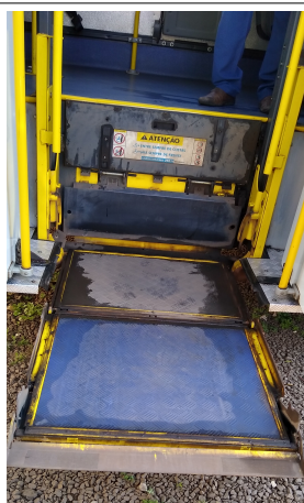
Foto 1 Plataforma Elevatória