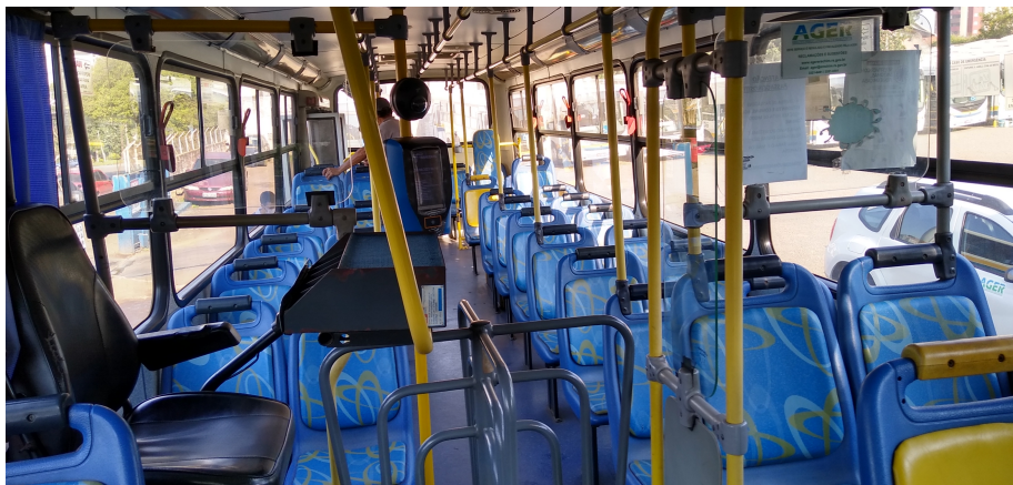
Foto 2 Interior do veículo