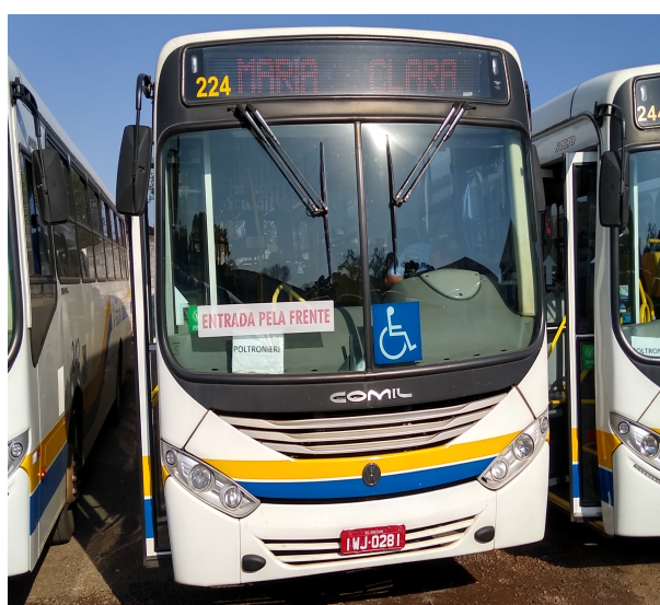
Foto 4 Informações do Itinerário