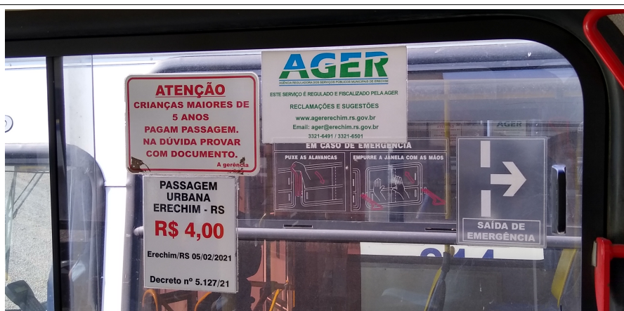
Foto 3 Informações sobre valor da tarifa e telefone da AGER