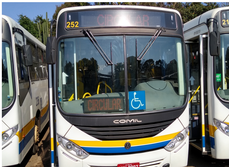
Foto 4 Informações do Itinerário