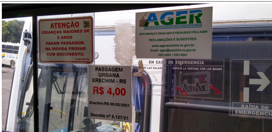
Foto 3 Informações sobre valor da tarifa e telefone da AGER