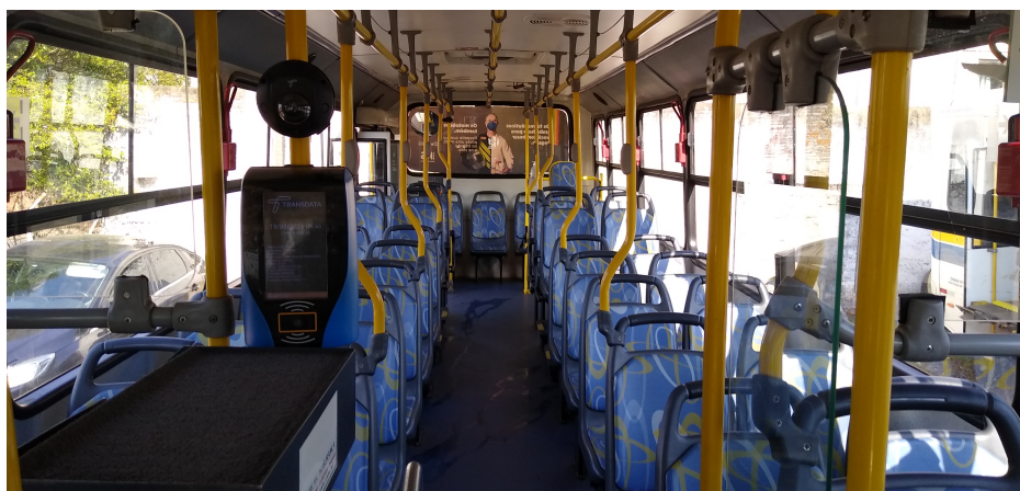
Foto 2 Interior do veículo