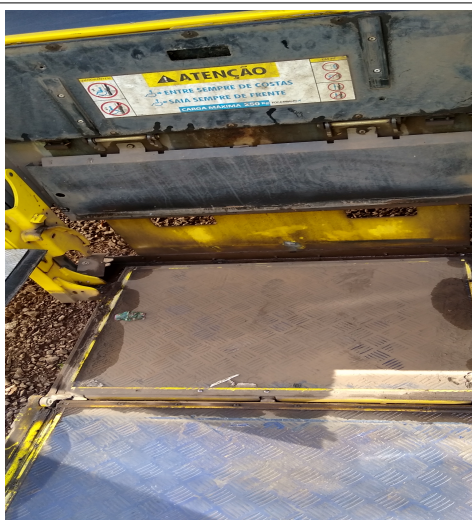
Foto 1 Plataforma Elevatória