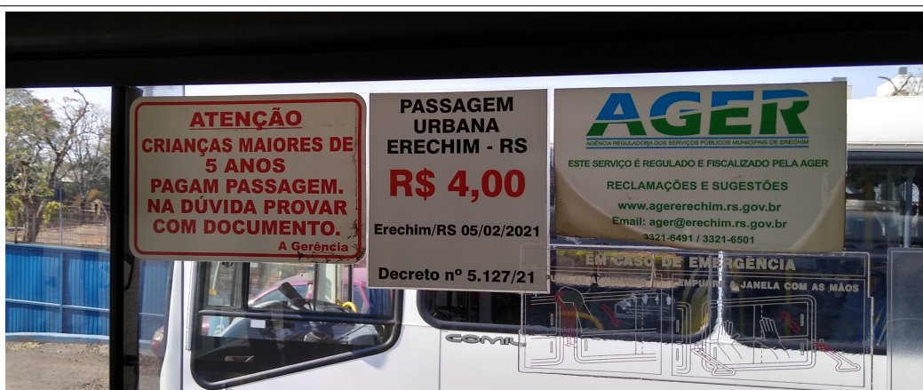
Foto 3 Informações sobre valor da tarifa e telefone da AGER