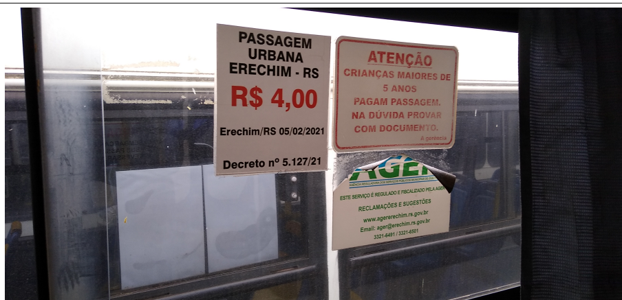
Foto 3 Informações sobre valor da tarifa e telefone da AGER