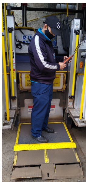
Foto 1 Plataforma Elevatória