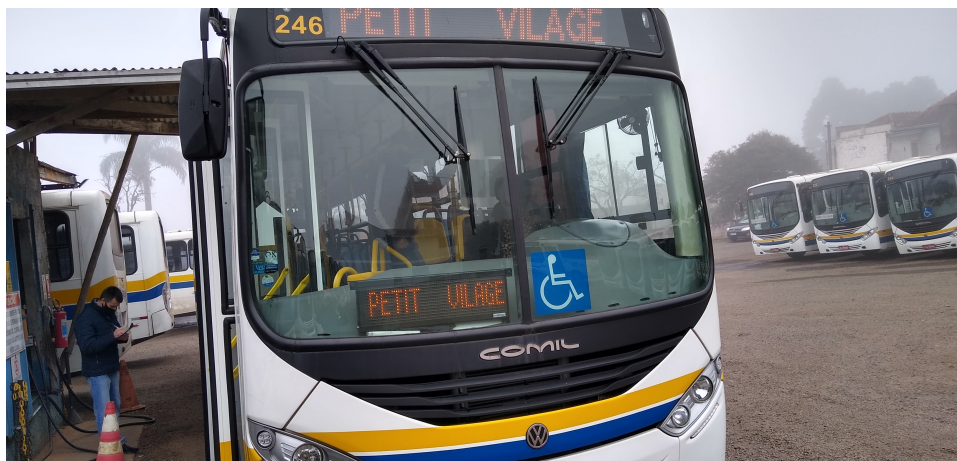
Foto 4 Informações do Itinerário