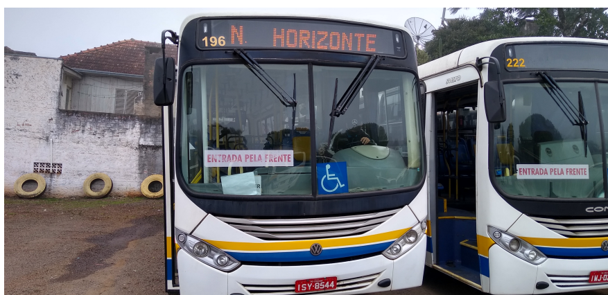
Foto 4 Informações do Itinerário