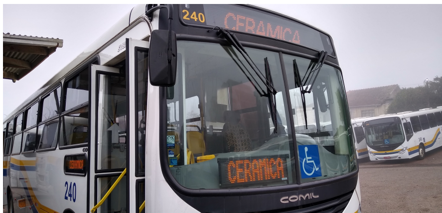
Foto 4 Informações do Itinerário