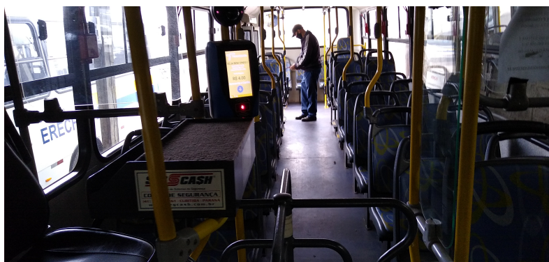
Foto 2 Interior do veículo