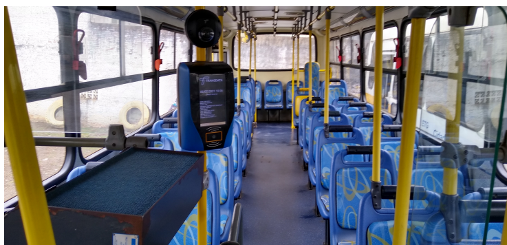
Foto 2 Interior do veículo