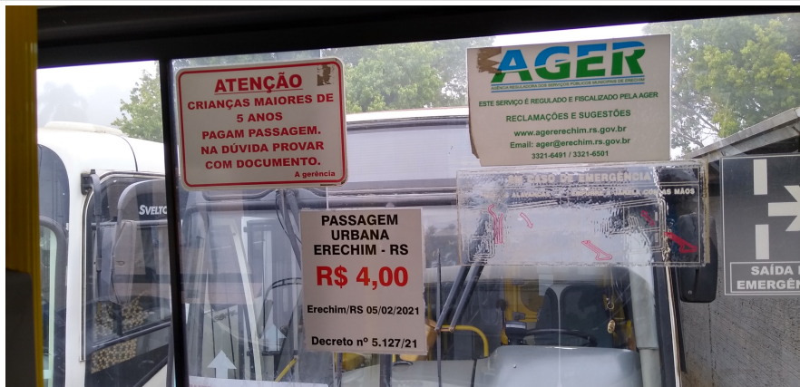
Foto 3 Informações sobre valor da tarifa e telefone da AGER