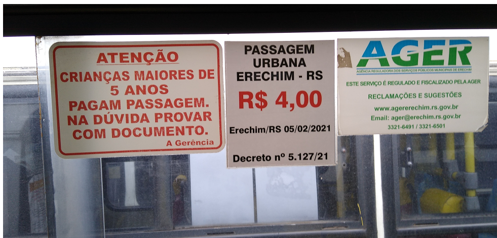
Foto 3 Informações sobre valor da tarifa e telefone da AGER