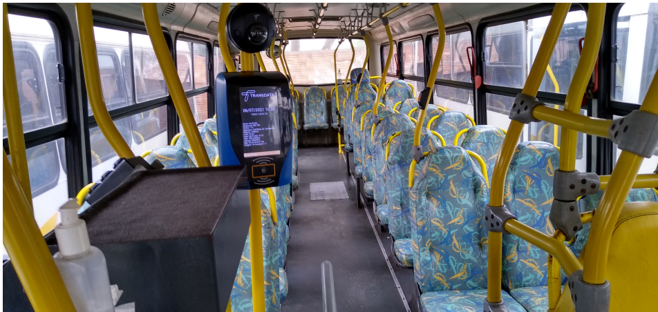
Foto 2 Interior do veículo