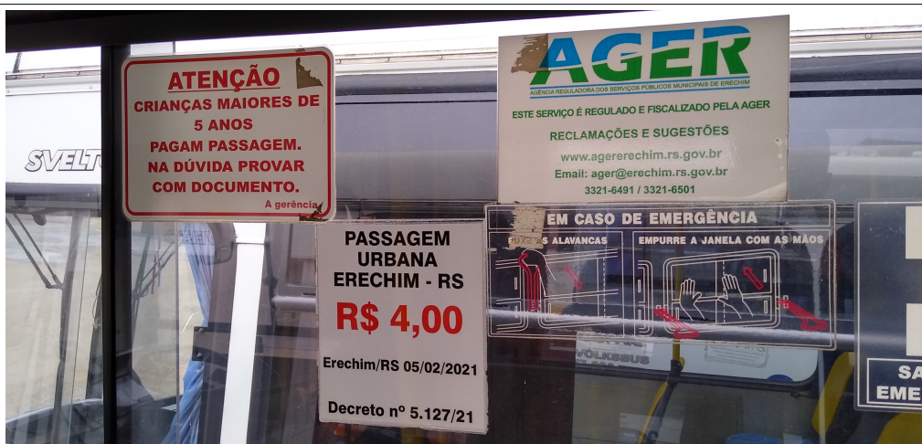
Foto 3 Informações sobre valor da tarifa e telefone da AGER