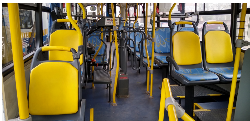
Foto 2 Interior do veículo