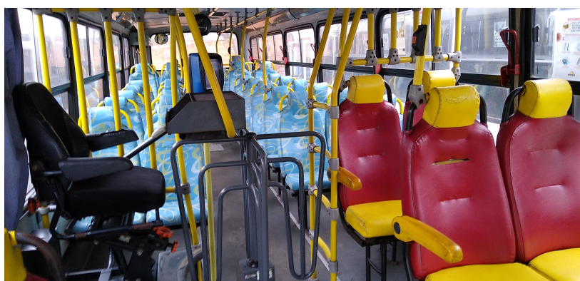
Foto 2 Interior do veículo