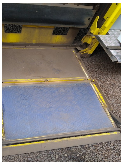
Foto 1 Plataforma Elevatória