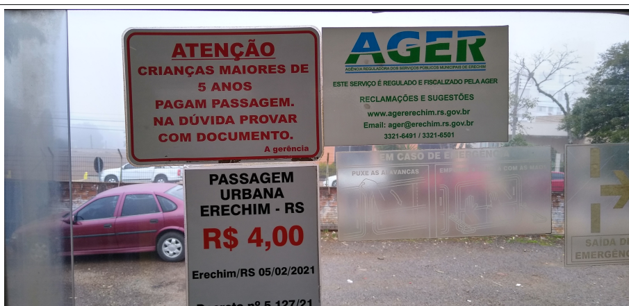
Foto 3 Informações sobre valor da tarifa e telefone da AGER