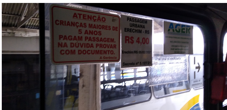
Foto 3 Informações sobre valor da tarifa e telefone da AGER