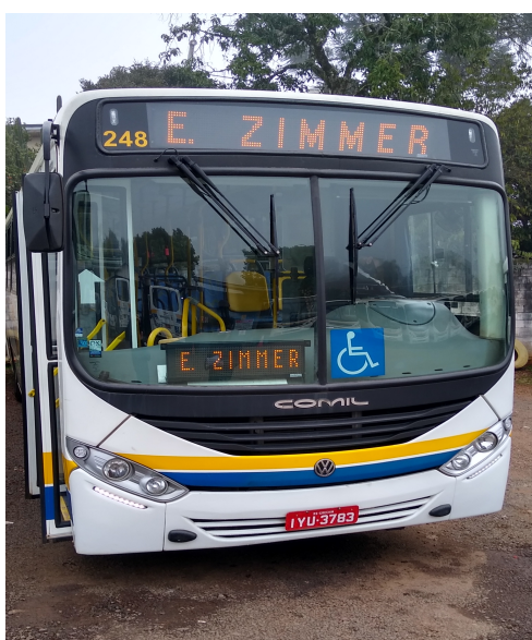
Foto 4 Informações do Itinerário