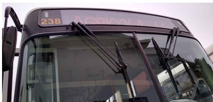
Foto 4 Informações do Itinerário