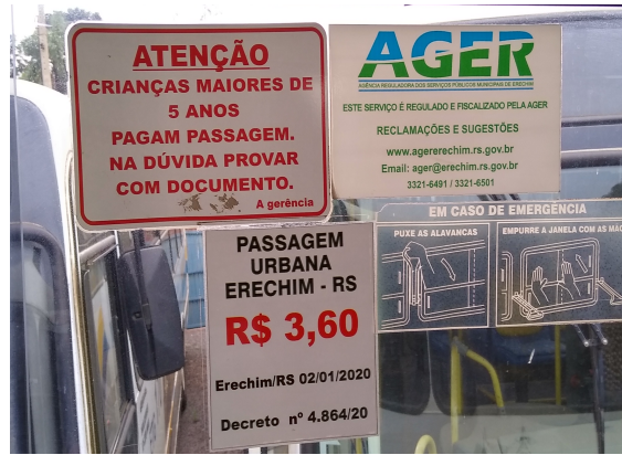
Foto 3 Informações sobre valor da tarifa e telefone da AGER