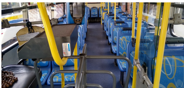
Foto 2 Interior do veículo