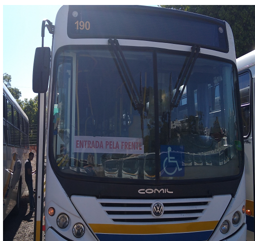
Foto 4 Informações do Itinerário