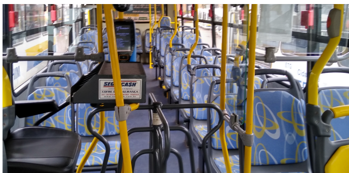
Foto 2 Interior do veículo