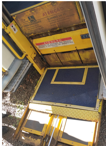
Foto 1 Plataforma Elevatória