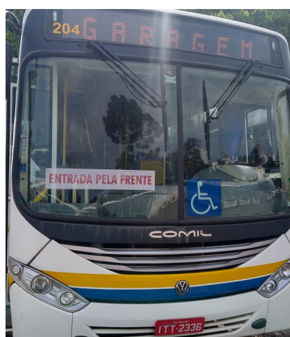
Foto 4 Informações do Itinerário