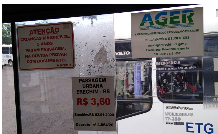
Foto 3 Informações sobre valor da tarifa e telefone da AGER