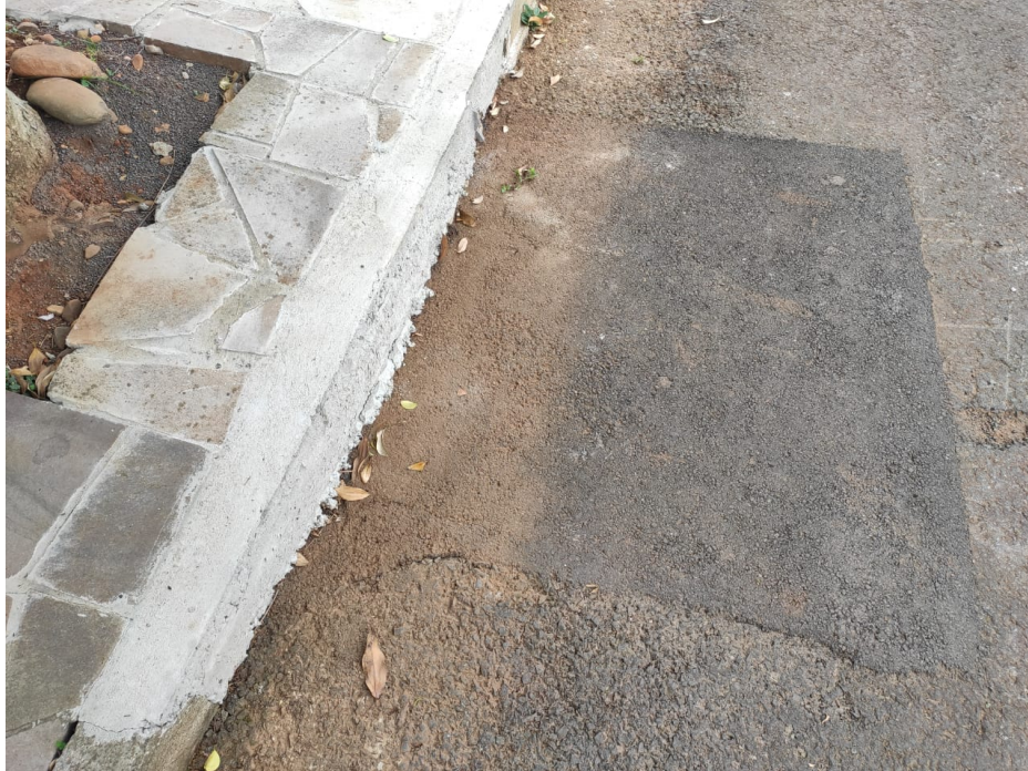
Recomposições asfalto e passeio adequadas.

Rua Jerônimo Teixeira esquina Av. Comandante Krammer