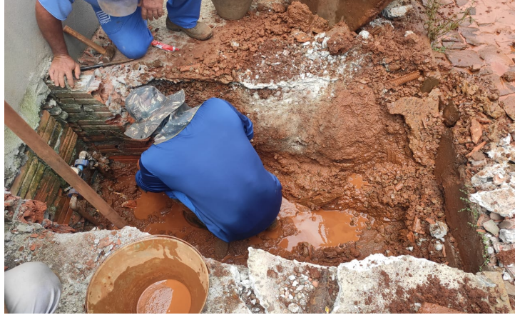
Conserto de vazamento no hidrômetro.