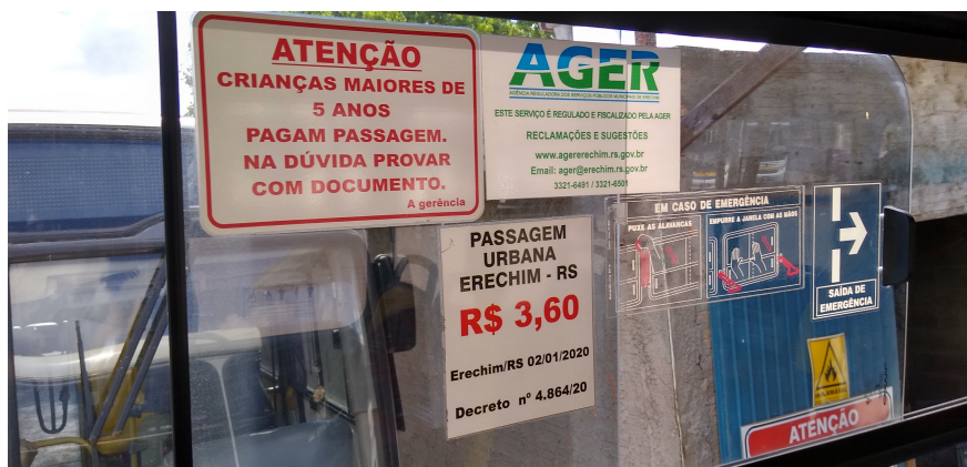
Foto 3 Informações sobre valor da tarifa e telefone da AGER