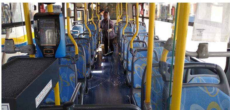
Foto 2 Interior do veículo