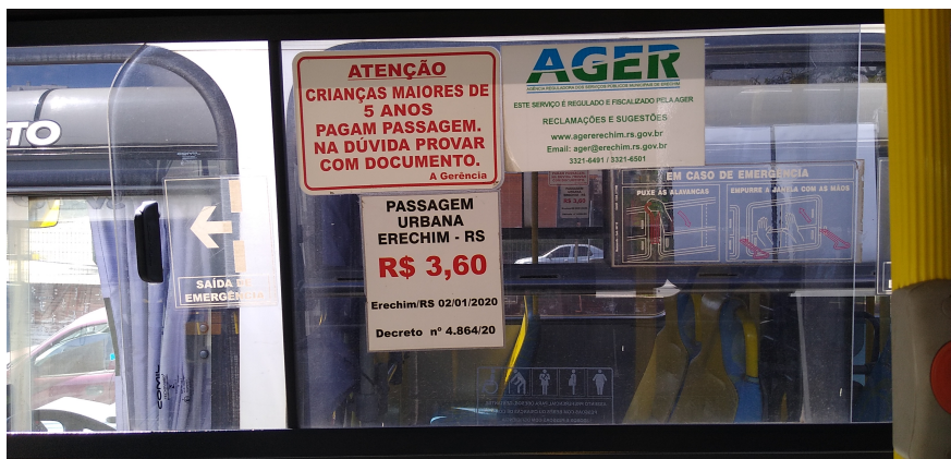
Foto 3 Informações sobre valor da tarifa e telefone da AGER