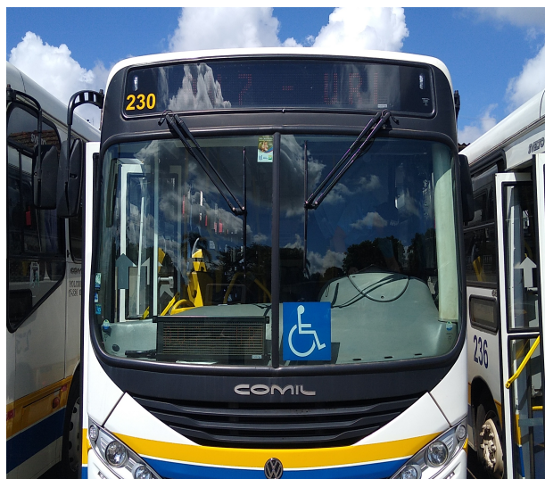
Foto 4 Informações do Itinerário