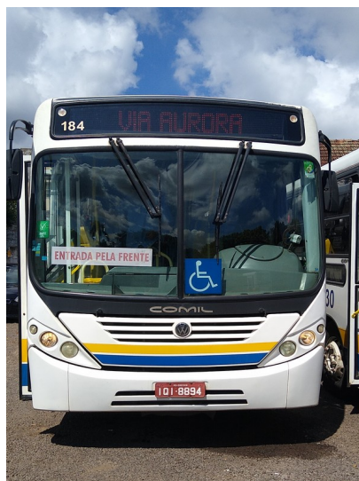
Foto 4 Informações do Itinerário