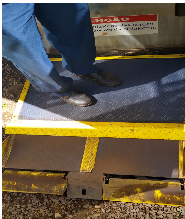
Foto 1 Plataforma Elevatória