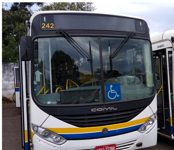
Foto 4 Identificação do veículo