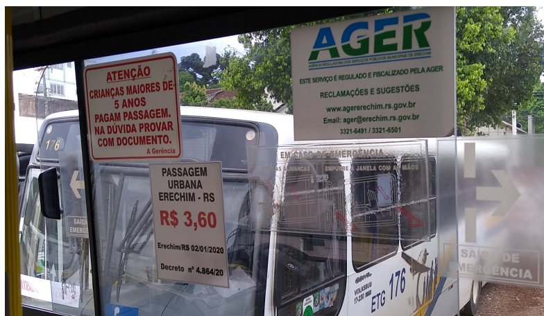
Foto 3 Informações sobre valor da tarifa e telefone da AGER