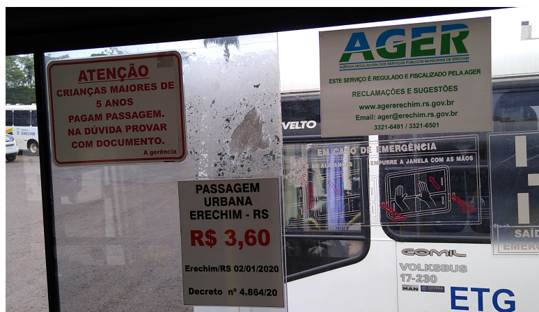
Foto 3 Informações sobre valor da tarifa e telefone da AGER