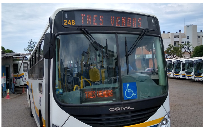
Foto 4 Informações do Itinerário