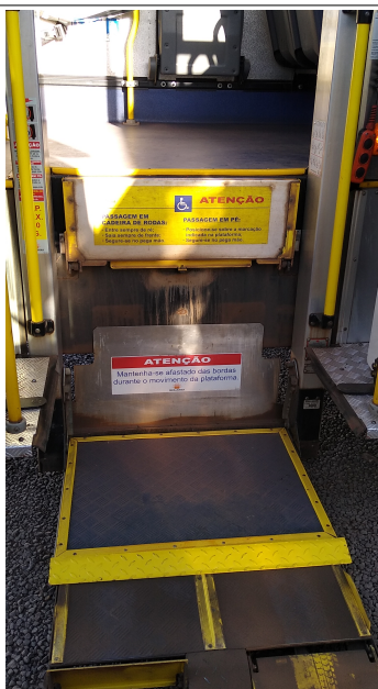
Foto 1 Plataforma Elevatória