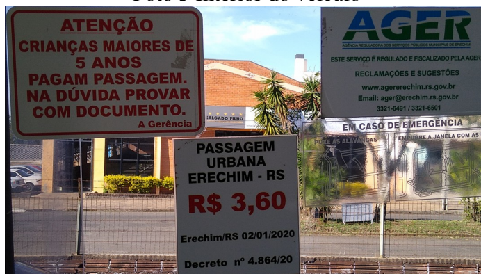
Foto 4 Informações sobre valor da tarifa e telefone da AGER