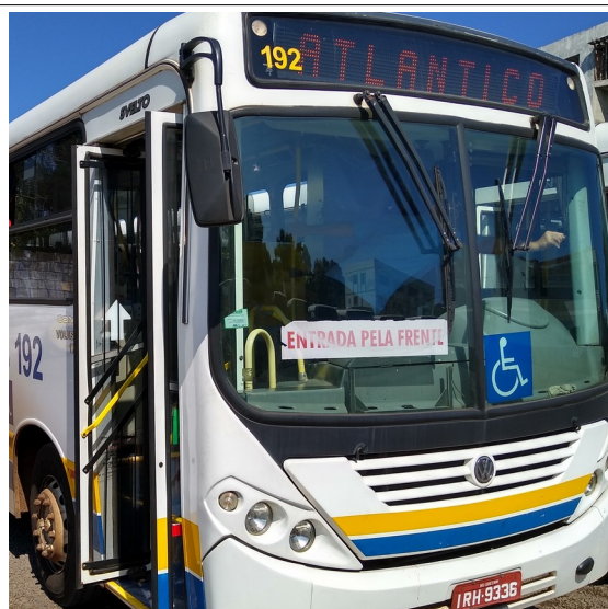
Foto 2 Identificação do Itinerário