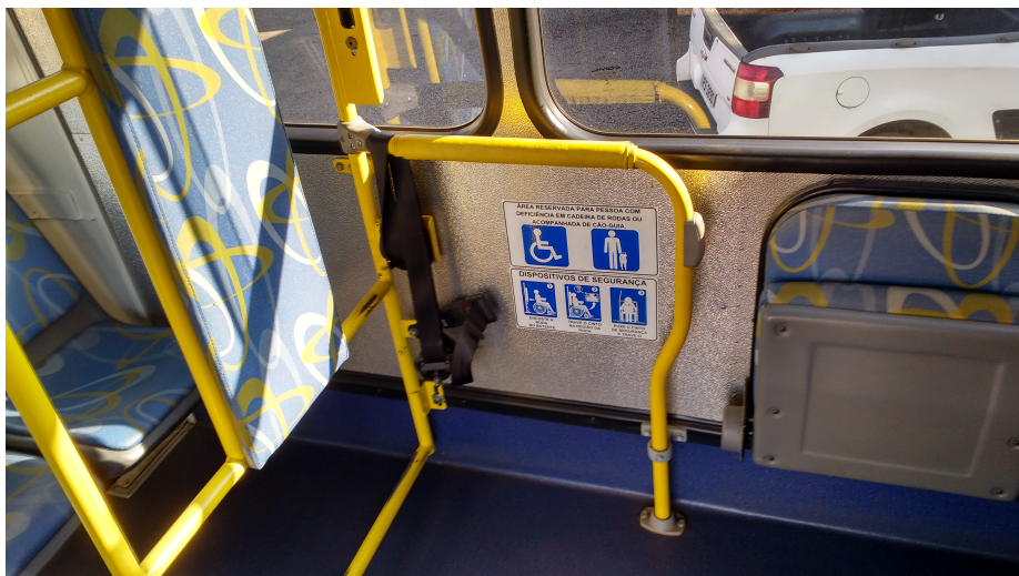
Foto 4 Espaço para cadeirante