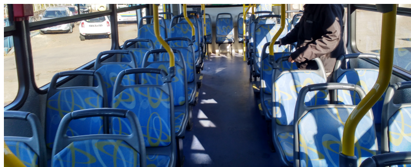
Foto 2 Interior do veículo