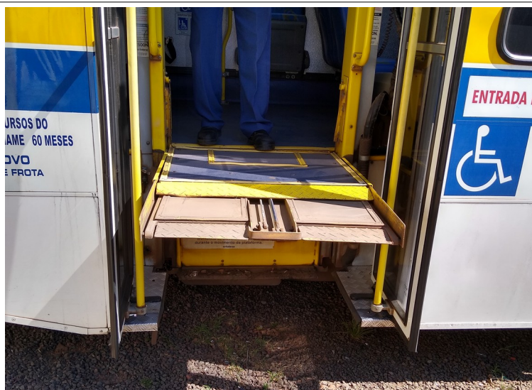
Foto 1 Plataforma Elevatória