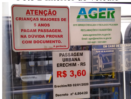
Foto 3 Informações sobre valor da tarifa e telefone da AGER