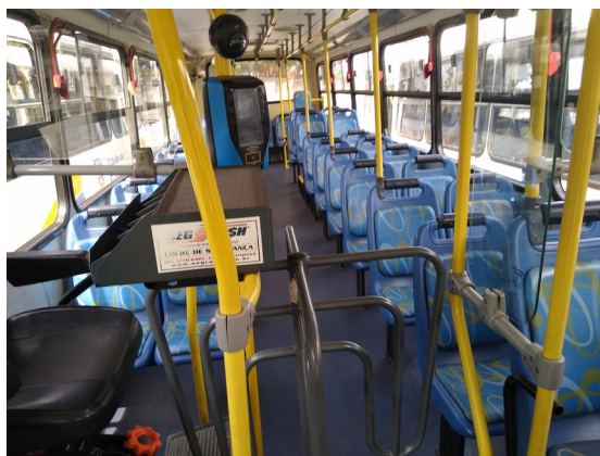
Foto 3 Interior do veículo