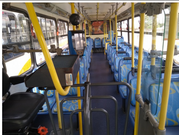
Foto 3 Interior do veículo