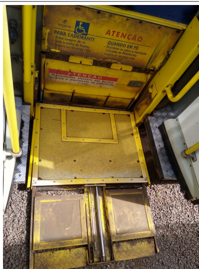
Foto 1 Plataforma Elevatória