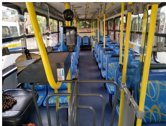
Foto 3 Interior do veículo