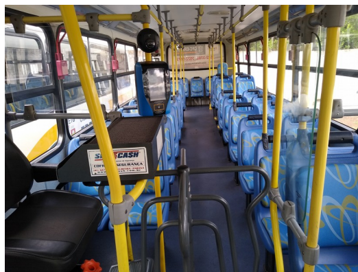
Foto 3 Interior do Veículo