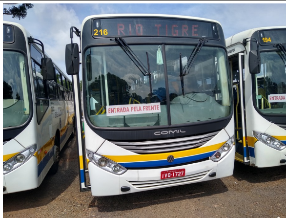
Foto 2 Identificação do Itinerário