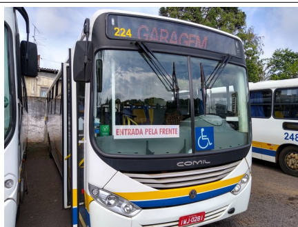
Foto 2 Identificação do veículo e do itinerário