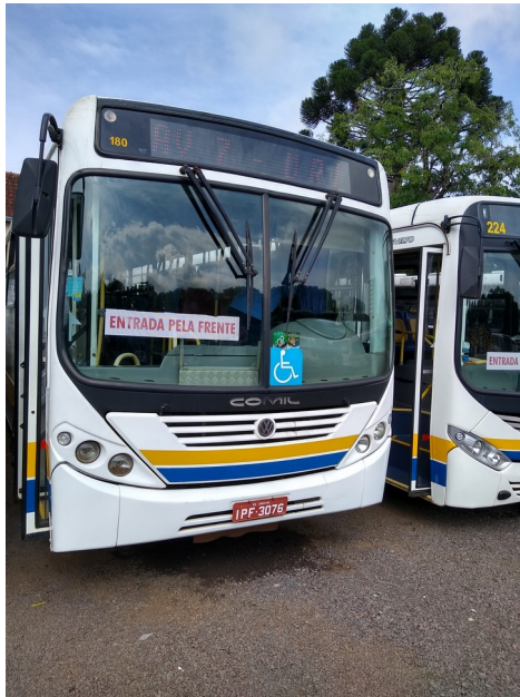
Foto 2 Identificação do veículo e do itinerário