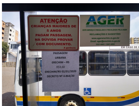
Foto 4 Informações como valor da tarifa e telefone da AGER