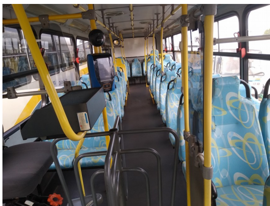
Foto 3 Interior do veículo