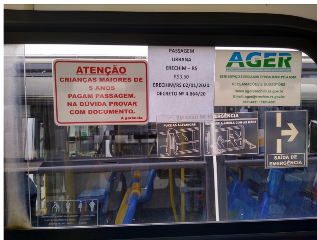
Foto 4 Informações como valor da tarifa e telefone da AGER