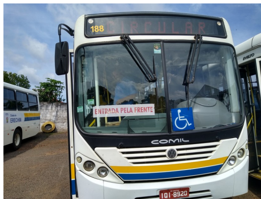
Foto 2 Identificação do Itinerário