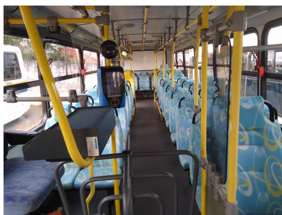
Foto 3 Interior do veículo