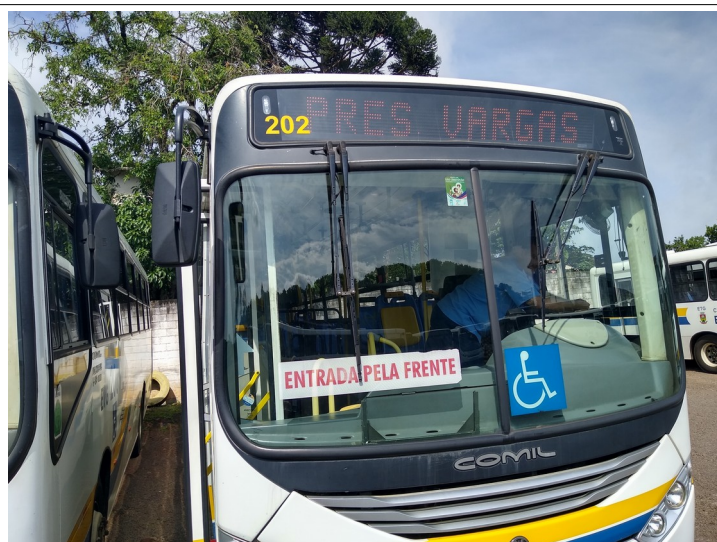
Foto 2 Identificação do Itinerário