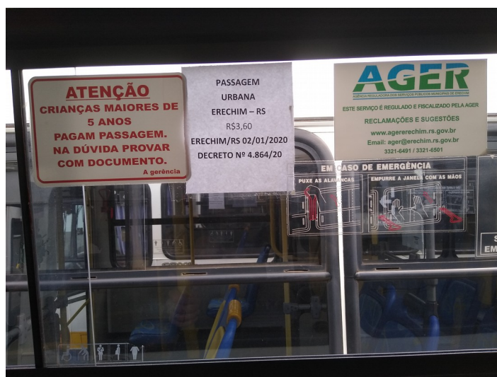
Foto 3 Informações como valor da tarifa e telefone da AGER