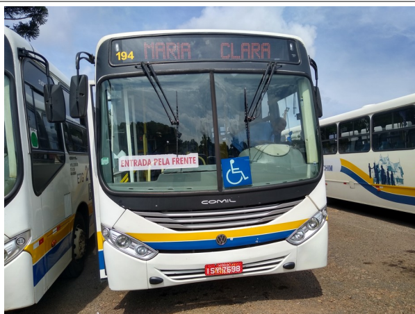
Foto 2 Identificação do Itinerário