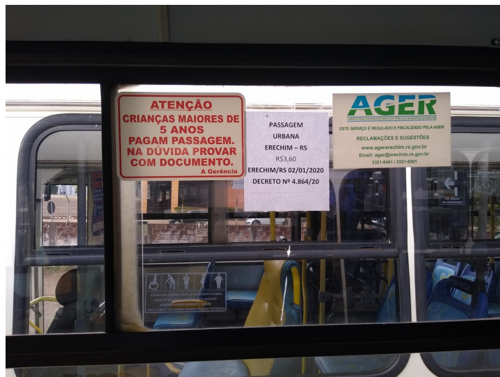
Foto 3 Informações como valor da tarifa e telefone da AGER