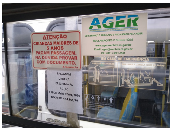
Foto 4 Informações como valor da tarifa e telefone da AGER