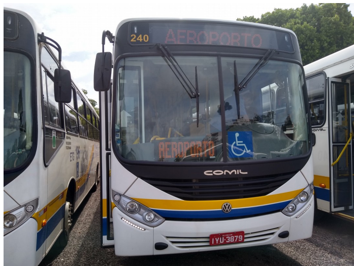
Foto 2 Identificação do veículo e do itinerário