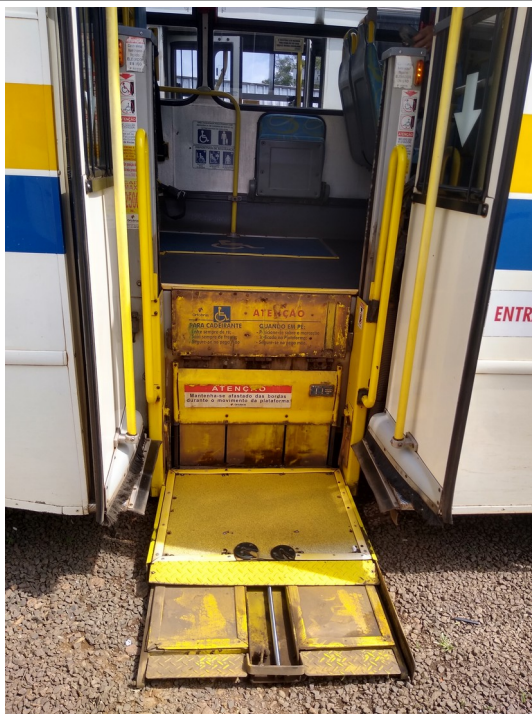
Foto 1 Plataforma Elevatória