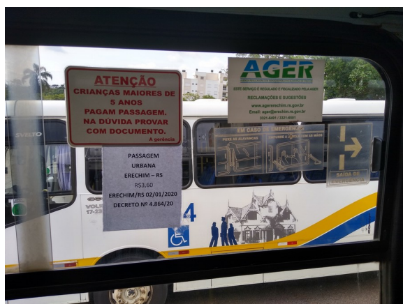
Foto 4 Informações como valor da tarifa e telefone da AGER