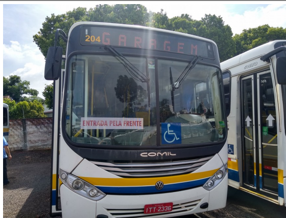
Foto 2 Identificação do Itinerário