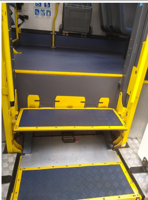
Foto 1 Plataforma Elevatória