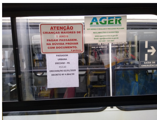
Foto 4 Informações como valor da tarifa e telefone da AGER