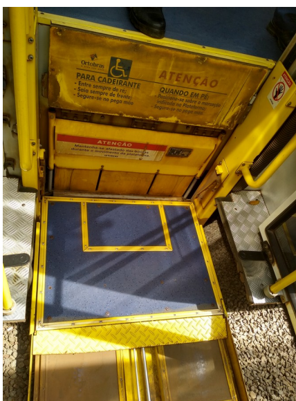
Foto 1 Plataforma Elevatória