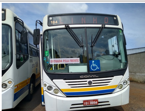
Foto 2 Identificação do Itinerário