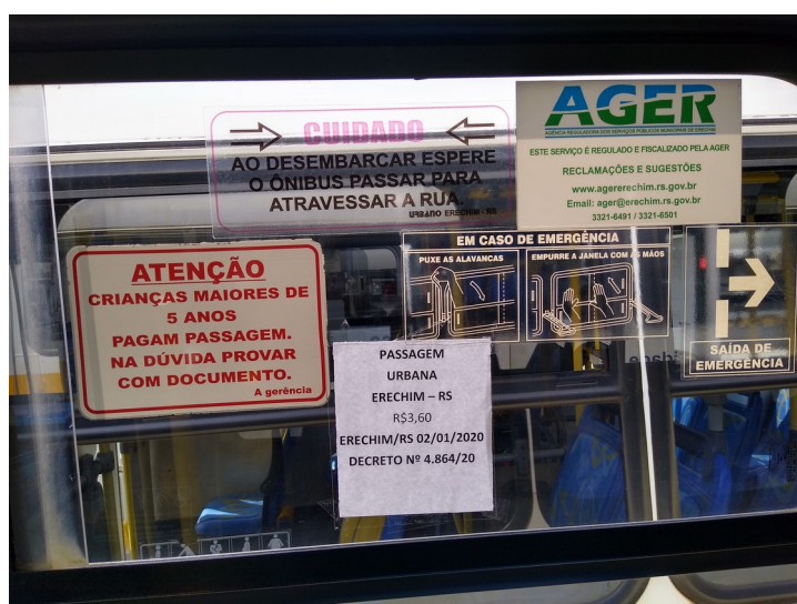
Foto 3 Informações sobre valor da tarifa e telefone da AGER