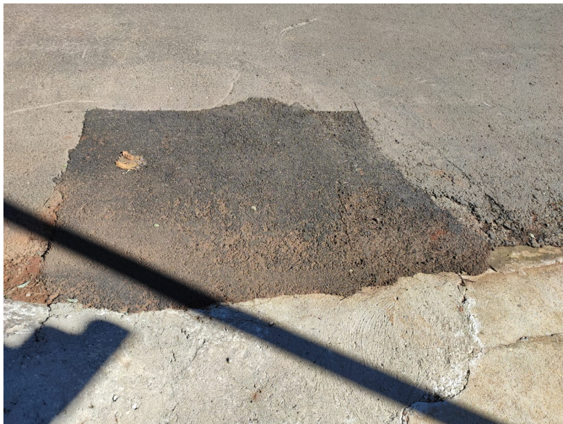
Recomposição adequada. Além da recomposição de CBUQ, também foi realizada a recomposição do passeio.