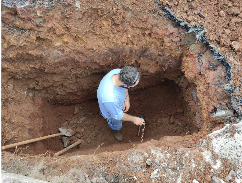
Conserto de vazamento detectado pela pesquisa.